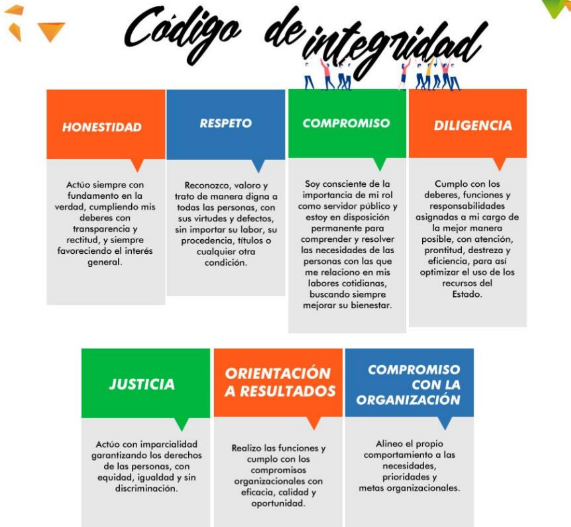
Figura 1 Código de Integridad